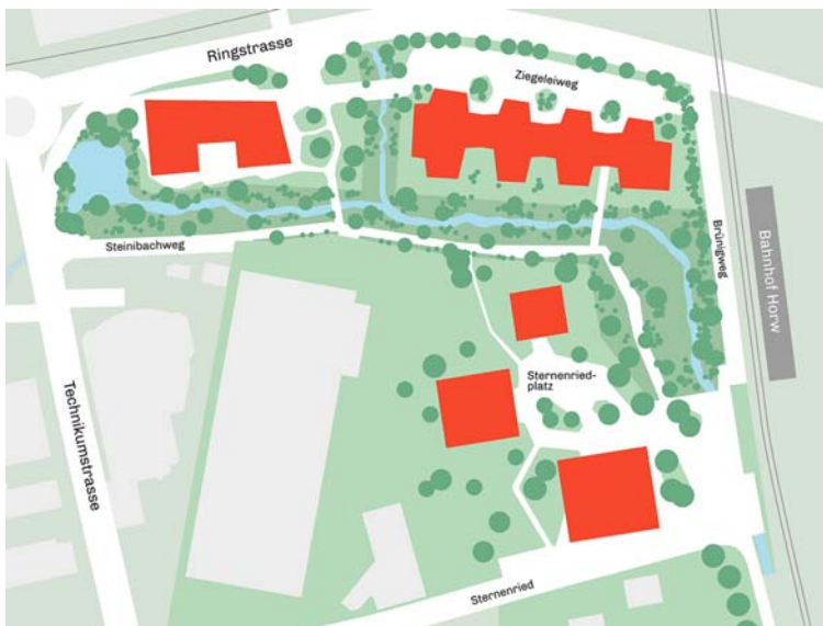
Situationsplan Ziegeleipark, Baufelder Mitte und Nord