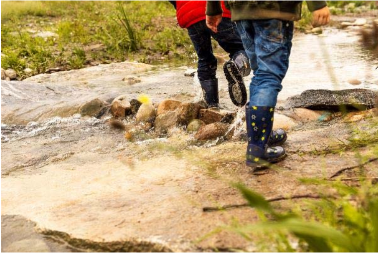
Ziegeleipark mit Steinibach