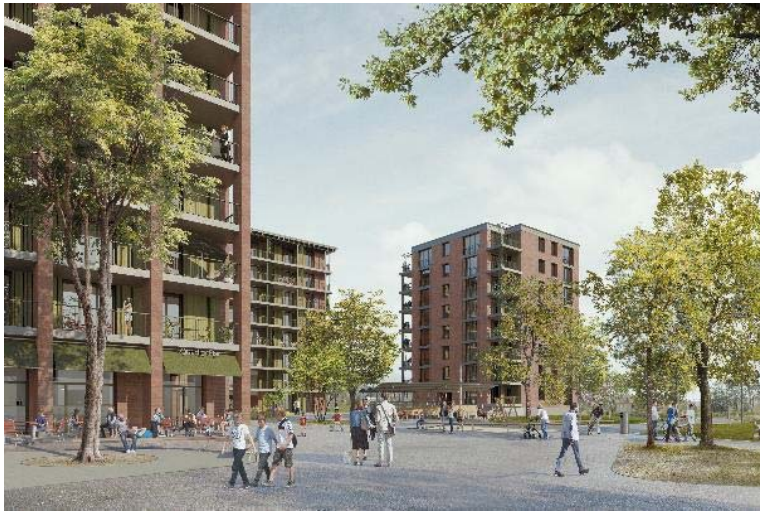
Sternriedplatz, die drei Gebäude des Baufelds Mitte