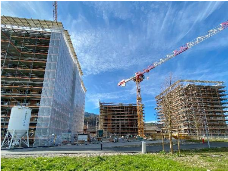
Baufeld Mitte, Frühling 2020